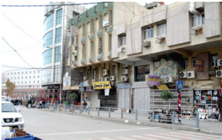
Im Gegensatz zu Bagdad ist es auf den Straßen Nord-Iraks relativ ruhig. Das letzte Attentat geschah 2007.