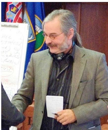
Die Konferenz prägte ein offenes, freundliches Gesprächsklima.