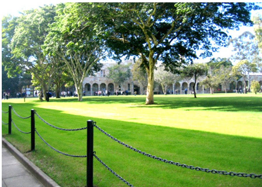
ACPACS ist ein Center des „Institute for Social Science Research“ an der „University of Queensland“, die größte Universität in Brisbane. Hier der „Great Court“, der Innenhof des Universitätscampus.

diator eine zukunftsorientierte Win-Win-Lösung herbeiführen, das Verfahren begleiten und moderieren. Seine neutrale und unparteiliche Haltung zeigt sich in jedem Stadium des Verfahrens. Diese Form des Rollenverständnisses ist vergleichbar mit der in Deutschland vorherrschenden Auffassung von Mediation.