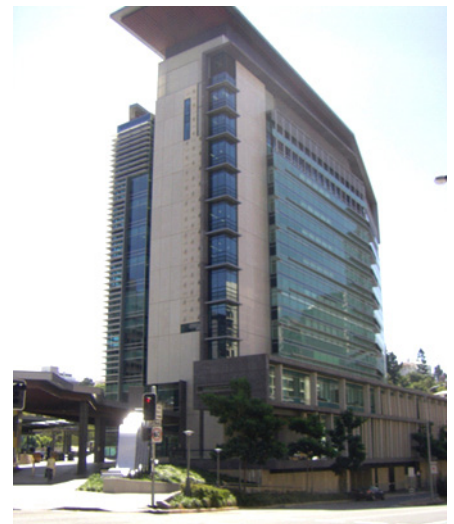
Brisbane Magistrates Court (Australien): Hier befindet sich die Mediationsstelle „Dispute Resolution Branch“ (DRB).

Das im Jahr 2008 in Australien eingeführte System ist der Beginn eines allgemein geltenden Standards mit wenigen (unabdingbaren) Regelungen. Es werden noch einige Jahre vergehen, bevor die neuen Standards von allen Mediationsgruppierungen, Richtern und Rechtsanwälten anerkannt werden und Außenstehende den „facilitativen Ansatz“ als Mediation erleben. Der freiwillige Charakter dieser Form der Regulierung erhält die Vielfalt der Mediation aufrecht. Das System