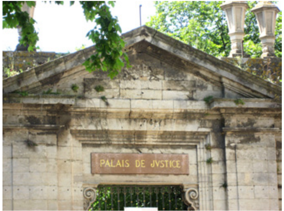
Die französische Gesetzgebung regelt im Bereich des Zivil- und Handelsrechts die Mediation sehr ausführlich.

hierbei um eine Angelegenheit der freiwilligen Gerichtsbarkeit. 27