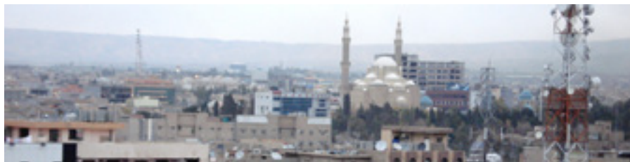
Ein Blick über die Stadt: Erbil gilt als eine der ältesten, ständig bewohnten Städte der Welt und existiert seit mehr als 4.000 Jahren.

Mit der sich stabilisierenden Sicherheit in der Region Kurdistan-Irak