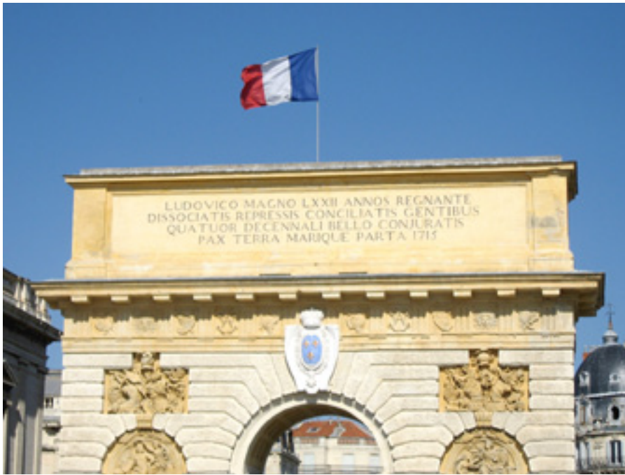
Das „Centre de Médiation et d'Arbitrage de Paris“ und die HK Hamburg gründeten 2006 feierlich das deutsch-französische Mediationszentrum.