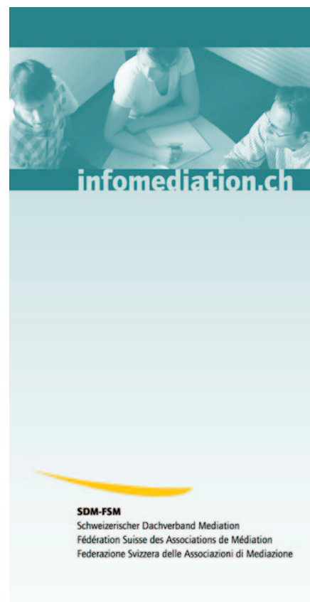
Flyer des SDM-FSM

Die Fachgruppe Mediation im öffentlichen Bereich (MiöB), ebenfalls eine gemeinsame Fachgruppe des Institutes für Mediation (IfM) und des Mediationsforums Schweiz (MFS), befasst sich mit Mediationen bei Umweltkonflikten, Immissionen, öffentlichen Bauten und Konflikten zwischen öffentlichen Organisationen. Anwendungsgebiete sind z. B. Projekte in den Bereichen Umwelt, Bau, Raumplanung und Verkehr, Deponien oder Kraftwerke, Abfallverbrennungsanlagen, Einkaufs- und Freizeitcenter. Dabei geht es häufig um Projekte, für deren Umsetzung mehrstufige Planungs- und Bewilligungsverfahren notwendig sind. Damit diese Schritte möglichst kostengünstig und ohne langwierige Auseinandersetzungen durchlaufen werden, gilt es, die Konfliktpunkte in einem kooperativen Verfahren frühzeitig zu erkennen und zu lösen. Hier bietet die Mediation eine gute