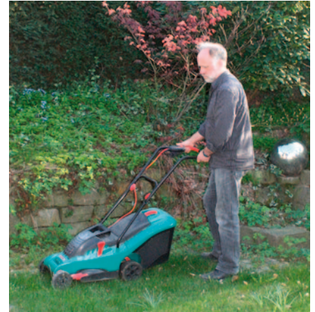
Samstags Rasenmähen ist für türkische Mitbürger rücksichtslos, denn im Islam ist Samstag ein Ruhetag.

Für das Projekt konnten bedeutende Kooperationspartner gewonnen werden. Der türkische Generalkonsul Dr. Akbulut (Essen) unterstützt die Arbeit des Vereins als Ehrenmitglied und die Ruhr-Universität Bochum wird entsprechende Lehrveranstaltungen organisieren. Darüber hinaus hat auch NRW-Justizminister Thomas Kutschaty seine Unterstützung des Deutsch-Türkischen